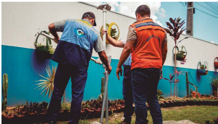
Equipamentos visam minimizar os problemas acarretados pelas chuvas