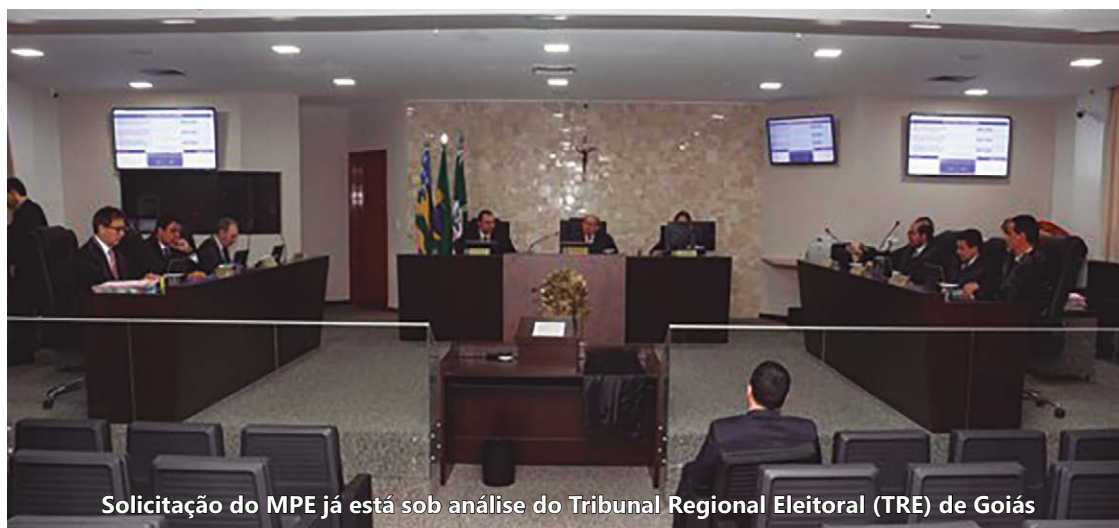
Solicitação do MPE já está sob análise do Tribunal Regional Eleitoral (TRE) de Goiás