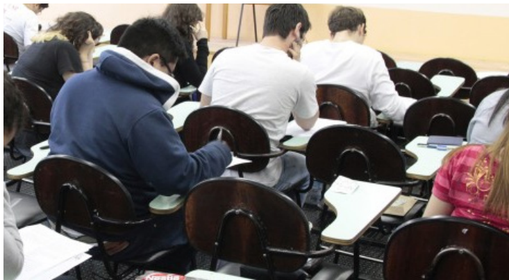
Neste domingo, 12, serão realizadas provas de matemática e ciências da natureza e suas tecnologias