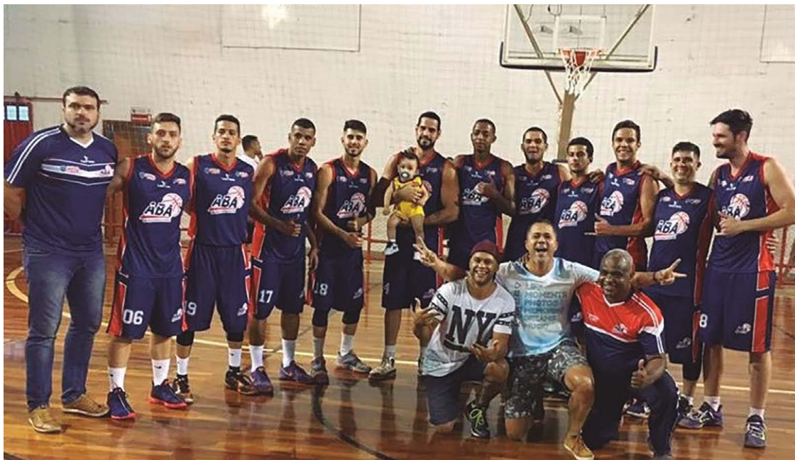
Foto 1: Vultures/UniEvangélica, equipe que se sagrou campeã em 2022, agora defende o título em 2023 Foto 2: Associação de Basquete de Anápolis, clube que tem como principal aposta a formação de atletas