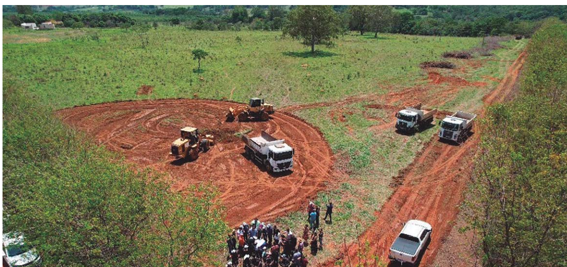
Máquinas e operários preparam a área do Politec, que, em breve, vai começar a receber projetos industriais

Paralelo ao andamento de implantação da infraestrutura, será publicado nos próximos dias um edital de chamamento com as regras para as empresas interessadas em se instalarem no Politec. As interessadas po-