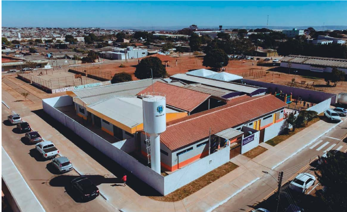
Projeto viabiliza recursos para creches e escolas, transporte escolar e o Programa Escola em Tempo Integral

As regras e os procedimentos de seleção e habilitação de propostas a serem apresentadas por estados, municípios e