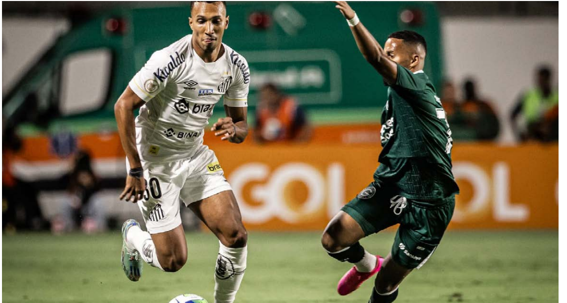
Com o estádio da Serrinha lotado e a torcida esmeraldina apoiando, Verdão perde jogo decisivo para o Peixe

Após um primeiro tempo fraco, sem grandes lances, a expectativa era grande para a etapa final, já que tanto o Goiás como o Santos, buscavam a vitória para fugir da zona de rebaixamento.