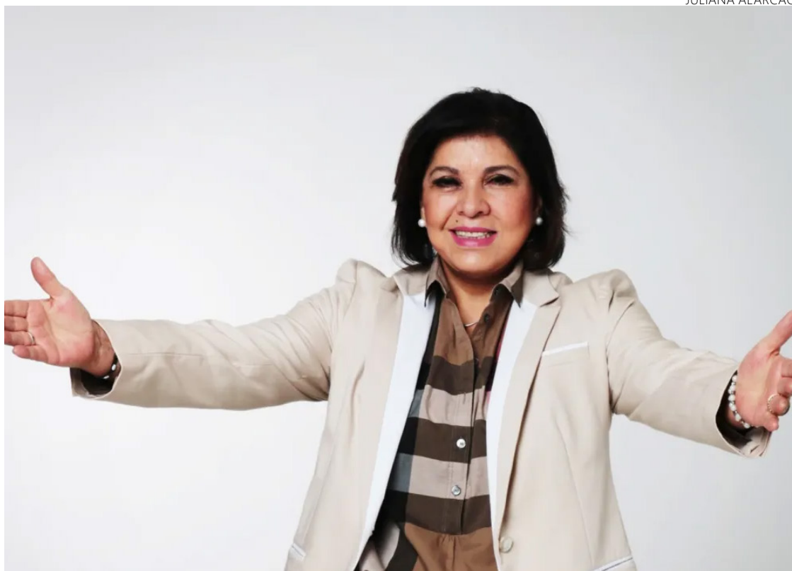
Roberta Miranda: desafios, reinvenção digital e o futuro da música sertaneja

“Posso dizer que foi muito, mas muito difícil mesmo chegar até aqui. Se hoje, as meninas do feminejo ainda falam de um possível preconceito, imagine isso há anos e anos atrás”, revelou Roberta Miranda sobre o preconceito com a música sertaneja.